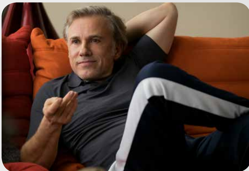
Der er altid nogen, som har regnet den ud, ligesom serbiske Dusan (Christoph Waltz).

me, og Paul vil ikke altid skulle gå rundt med dårlig samvittighed over ikke at slå til. De sælger alt og siger farvel til deres familie og 'store' venner. Proceduren er omfattende og foregår under fuld bedøvelse. Alt forløber planmæssigt for Paul, indtil han vågner og opdager, at Audrey ikke er der. Hun har fået kolde fødder. Og de er stadig i fuld størrelse.