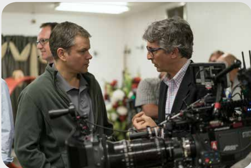
Alexander Payne har instrueret film som "Nebraska", "The Decendants" og "Rundt om Schmidt".

handler om os, altså os som publikum. Alle kan tage det med sig, de vil. Alle kan have deres egne tanker, associationer, bekymringer, overvejelser, morskab, eftertanke, projektioner, håb, frygt, tilfredsstillelse, skuffelse. Det taler til os hver især.