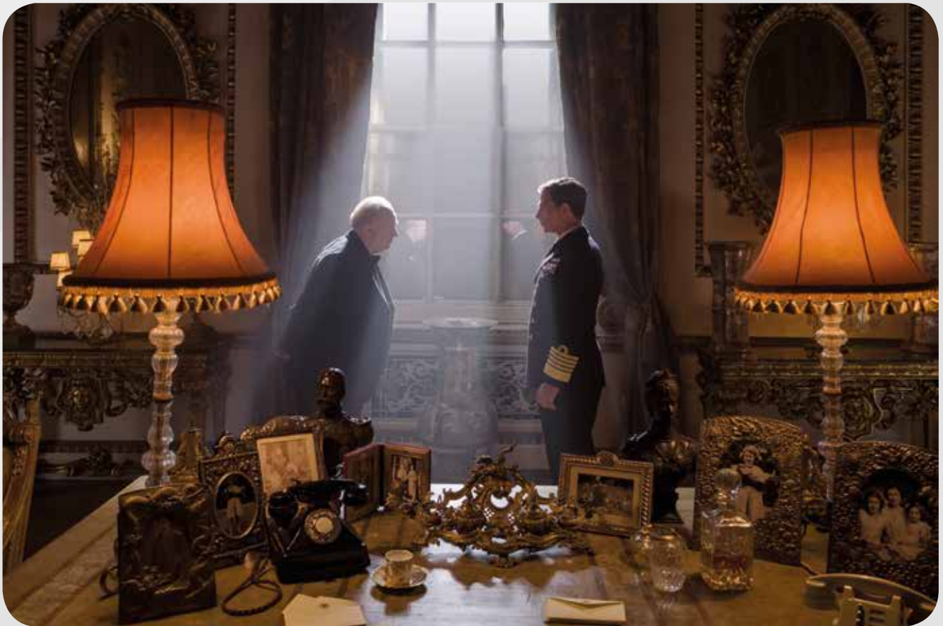
Kongen Georg IV (Ben Mendelsohn) accepterer parlamentets vilje, men er ikke begejstret for, at valget er faldet på Churchill.

skrev – er nogle af de fineste på det engelske sprog. Han var bemærkelsesværdig, fordi han ikke gik ind for rosenrød prosa eller overlæssede talerne med metaforer og billeder. Dem kunne han godt bruge, når han havde brug for det. Men han forstod det folk, han talte direkte til, og sikrede sig, at det, han sagde, gik lige ind i nationens hjerte.