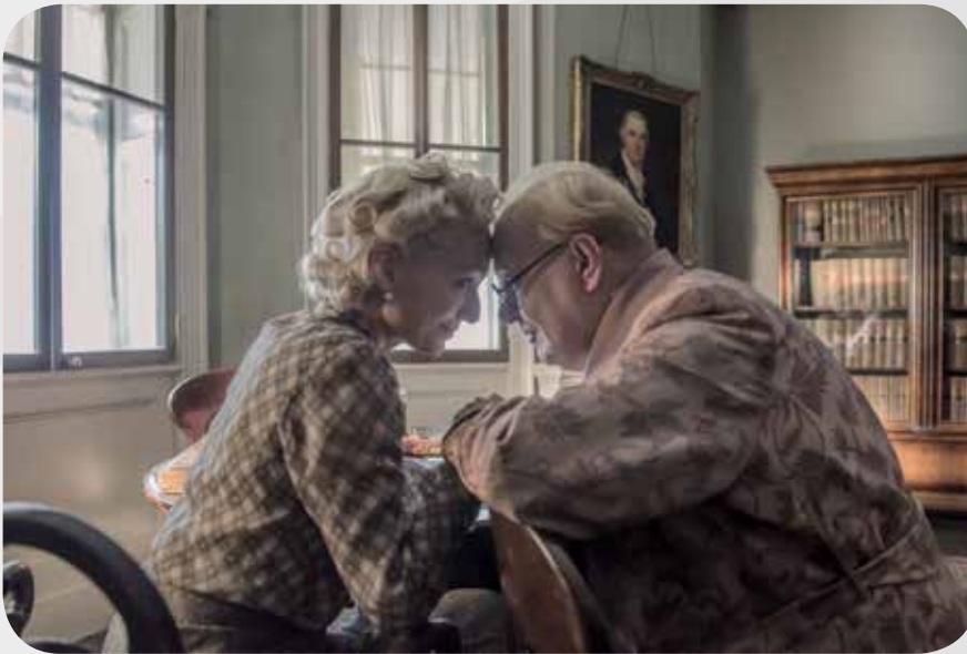
Churchill finder støtte hos sin elskede Clementine (Kristin Scott Thomas)

ikke magten er kommet til ham for sent – som 65-årig. Kongen Georg VI accepterer parlamentets vilje, men er ikke begejstret, fordi han stadig bebrejder Churchill, at han støttede hans brors ønske om at gifte sig med Wallis Simpson og abdicerer, så Georg blev tvunget til at påtage sig hvervet. Og Chamberlain og hans foretrukne efterfølger, Halifax, presser på for at få Churchill til at acceptere fredsførelse gennem den italienske diktator Mussolini.