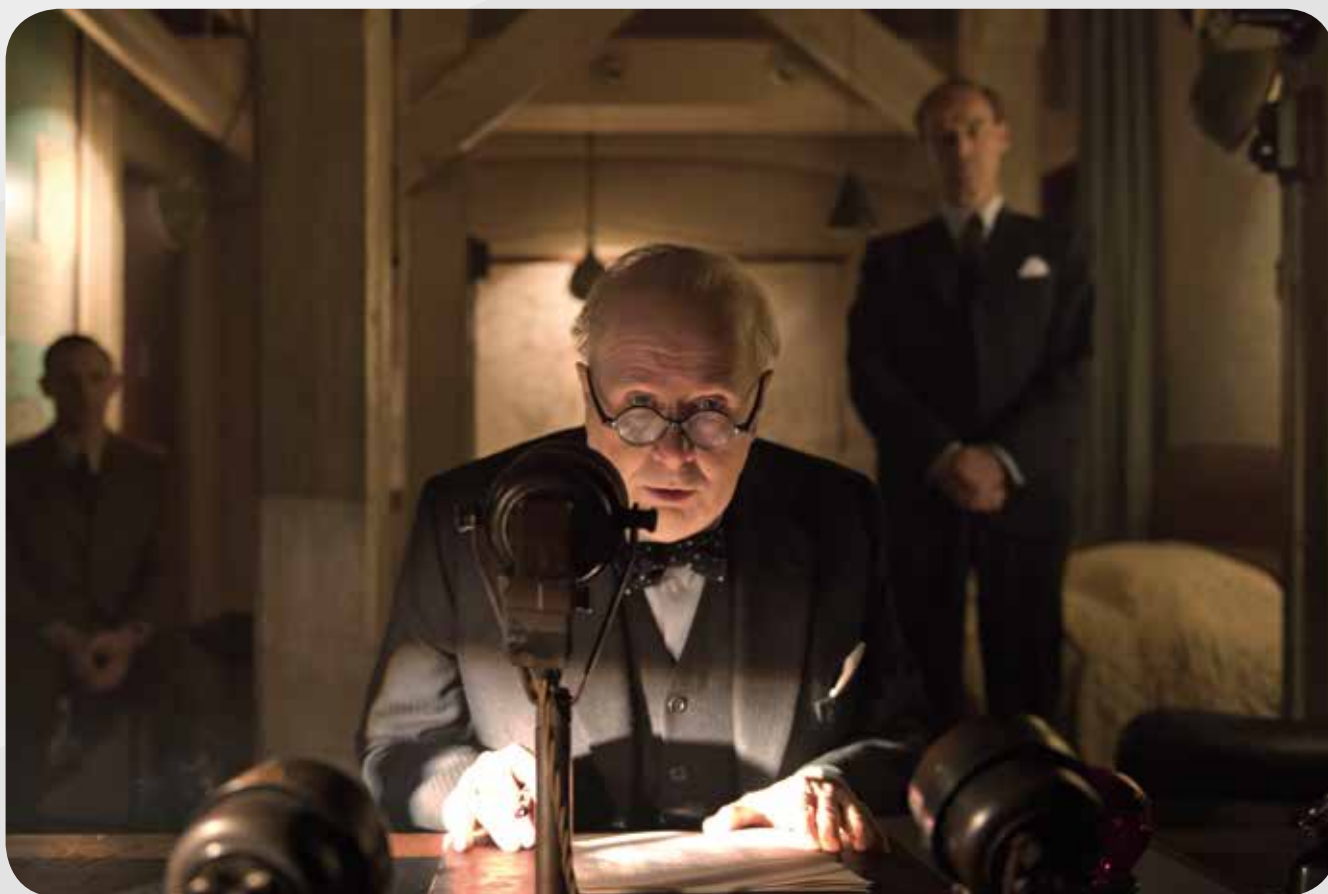
Gary Oldman har påtaget sig opgaven at portrættere den store statsmand Winston Churchill.