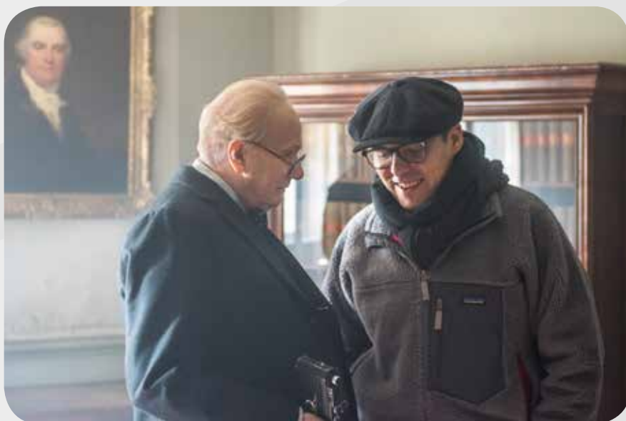
Joe Wright har instrueret "Anna Karenina", "Hanna", "Soning" og "Stolthed og fordøm".

- Når alt er sagt, så er dette nok det hårdeste job, jeg nogensinde har haft som skuespiller, siger Oldman. – Alligevel var det også det mest befriende. Jeg kunne slet ikke vente med at komme på arbejde og være Winston. Hver dag, når jeg mødte tænkte jeg, 'jeg er så heldig at få lov til at gøre det her'.