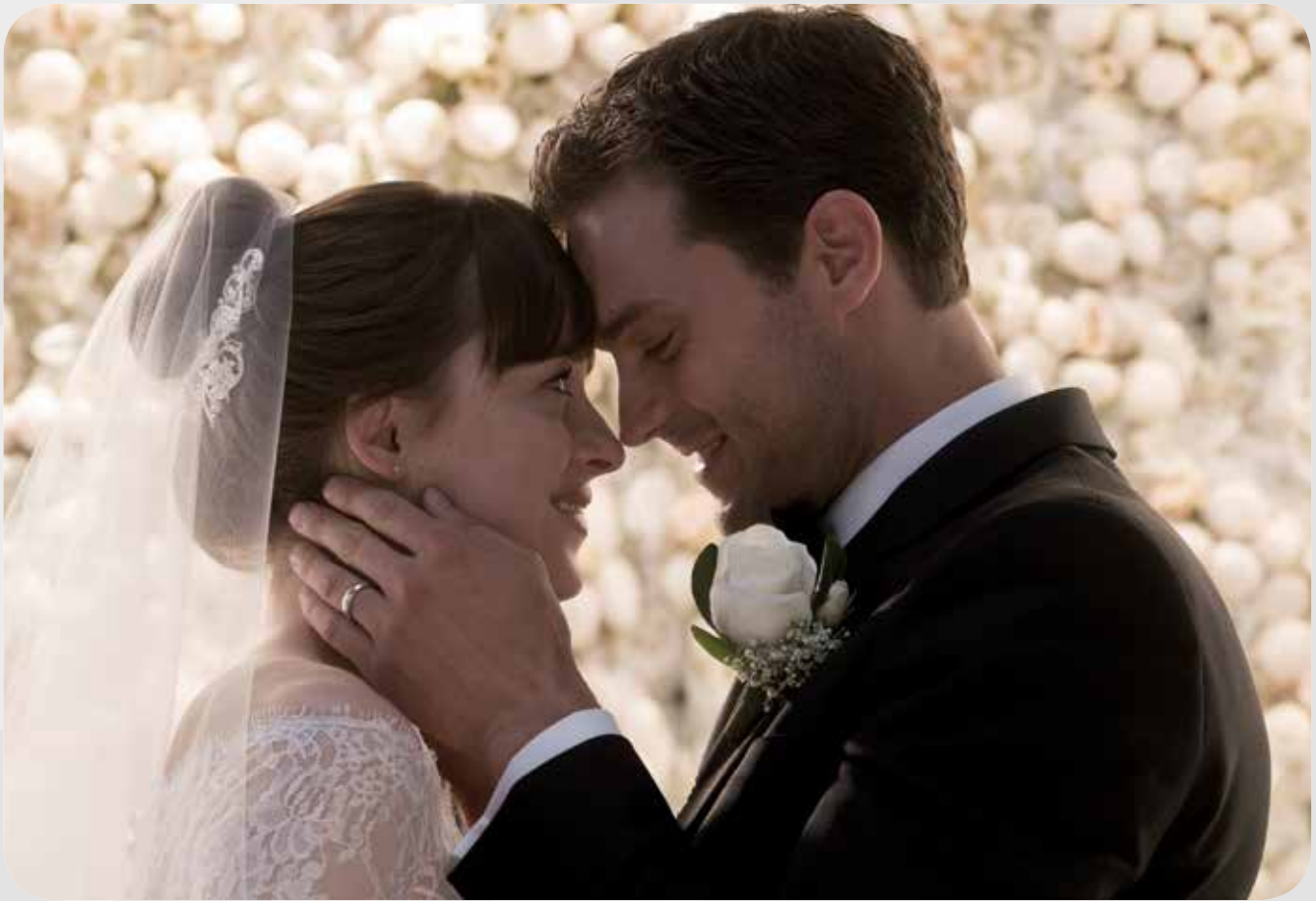
Christian Grey (Jamie Dornan) har friet til sin Anastasia (Dakota Johnson), og hun har sagt ja.