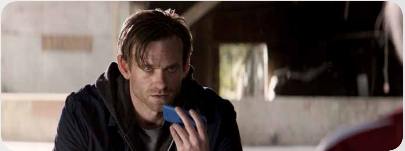
Jack Hyde (Eric Johnson) eneste mål i livet nu alene at ødelægge alt, Christian Grey har.

dele ved at være millionær – som når Anastasia beklager sin over, at hun aldrig har lejlighed til at være sammen med sine gamle venner, og Christian booker en bjerghytte i Colorado og inviterer dem alle afsted.